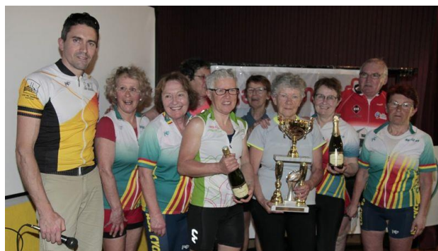
Ce sont les cyclotes d'Avrillé qui ont gagné le trophée l'an dernier aux Rosiers

Inscription gratuite pour les licenciées FFCT du Maine-et-Loire