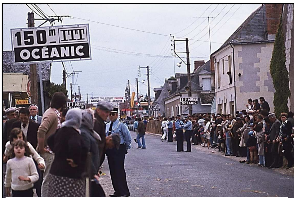
Avant la ligne d'arrivée : le service d'ordre, mais pas de barrières...

Le 4 juillet arrive. Malgré la fraîcheur ambiante et les giboulées annoncées, les spectateurs sont nombreux tout au long des 5 km du circuit final où l'on saucissonne joyeusement. Quand arrive la fâcheuse nouvelle : à 14h, la TV se met en grève ! Adieu l'eurovision et la retransmission en direct, la présence remarquée de Léon Zitronne n'y changera rien. Celle, plus discrète, de Robert Chapatte, non plus :