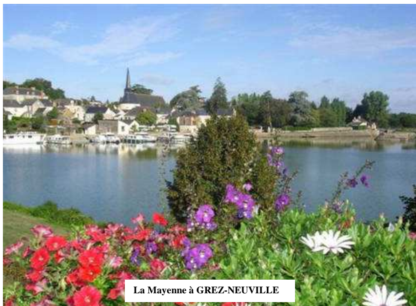
La Mayenne à GREZ-NEUVILLE

Cette randonnée, avec quelques bonnes grimpettes, vous permettra de mieux connaître cette région de notre ligue, riche en patrimoine historique et géographique.