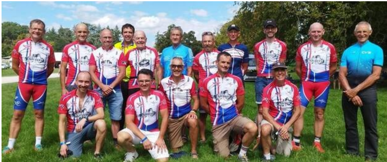
Les Randonneurs Cyclos de l'Anjou étaient 14 au départ de Paris-Brest-Paris, dix sont arrivés dans les temps. | CO

« J'ai eu envie de disputer l'épreuve en discutant avec un gars qui l'avait faite lors d'une sortie randonnée à vélo dans le Pas-de-Calais. C'était en 1972. Ça m'avait fasciné », explique le cyclo angevin dont le record date de 1979 avec un chrono de 52 heures et 26 minutes et une 12 ème place sur 1766 partants. Ils étaient 6820 de 71 nationalités cet été, entre le 20 et 24 août.